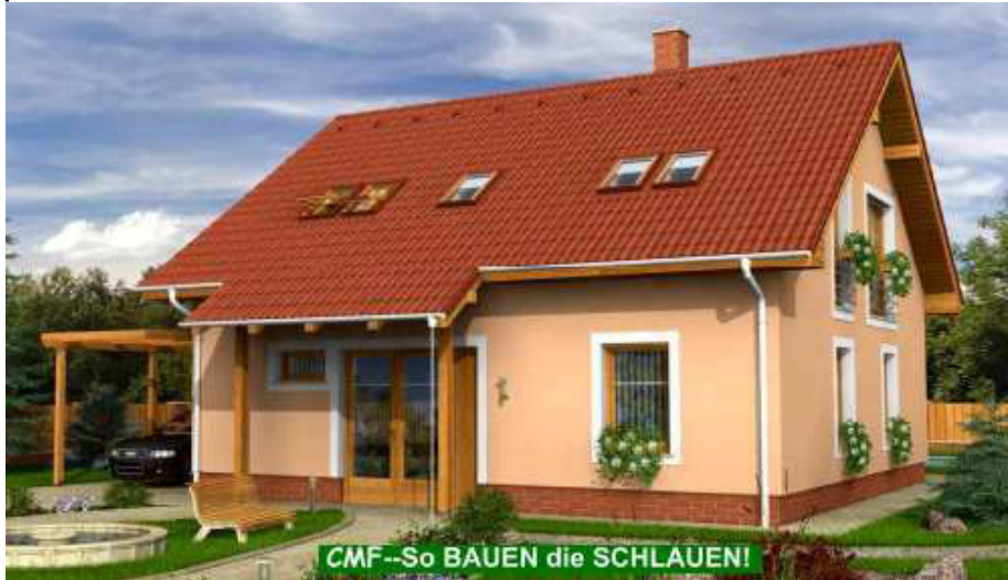
Foto Perspektive 1

— Im Standard einfarbige Putzfassade, Bemusterung nach Farbskala— — Abbildungen zeigen Sonderleistungen —