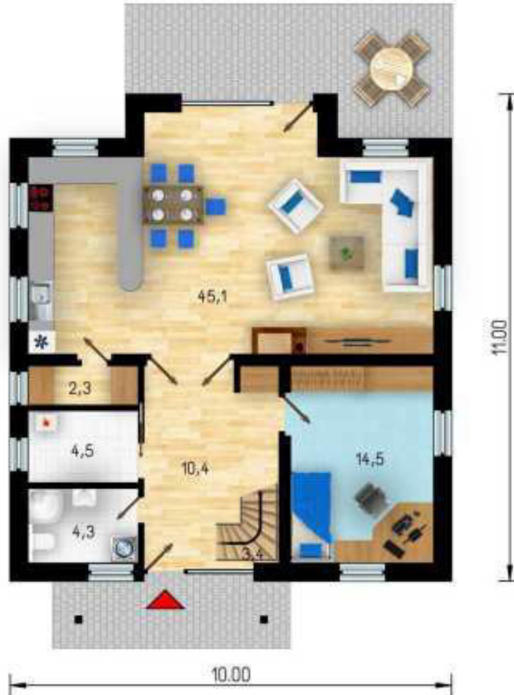
Erdgeschoss mit ca. 85 m 2 Wohn- Nutzfläche