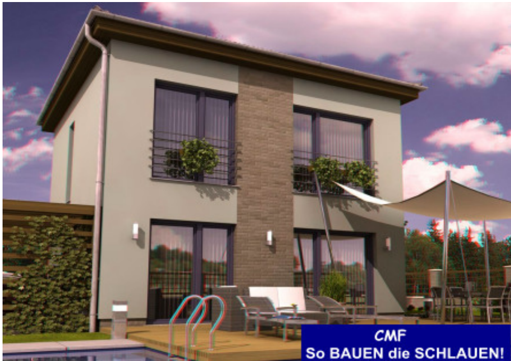
— Im Standard einfarbige Putzfassade, Bemusterung nach Farbskala — — Abbildung zeigt Sonderleistungen —