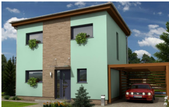
Luftbalkencarport ist nicht im Leistungsumfang