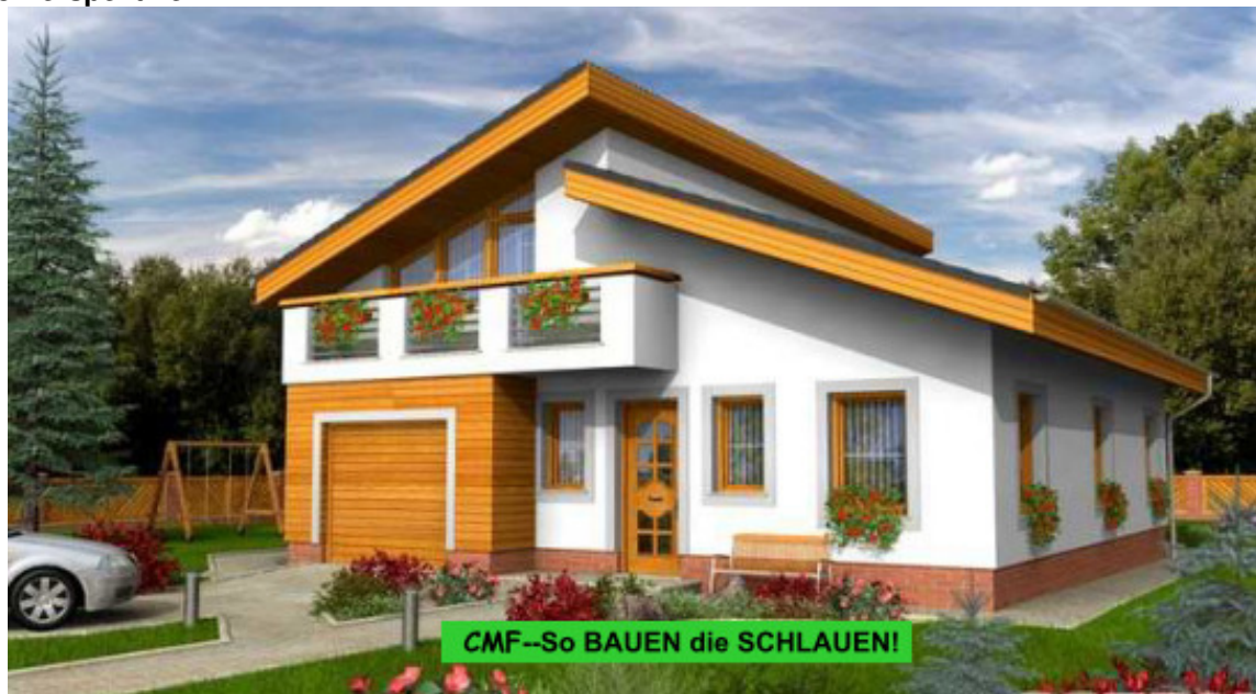
Foto Perspektive 1

— Im Standard einfarbige Putzfassade, Bemusterung nach Farbskala— — Abbildungen zeigen Sonderleistungen—