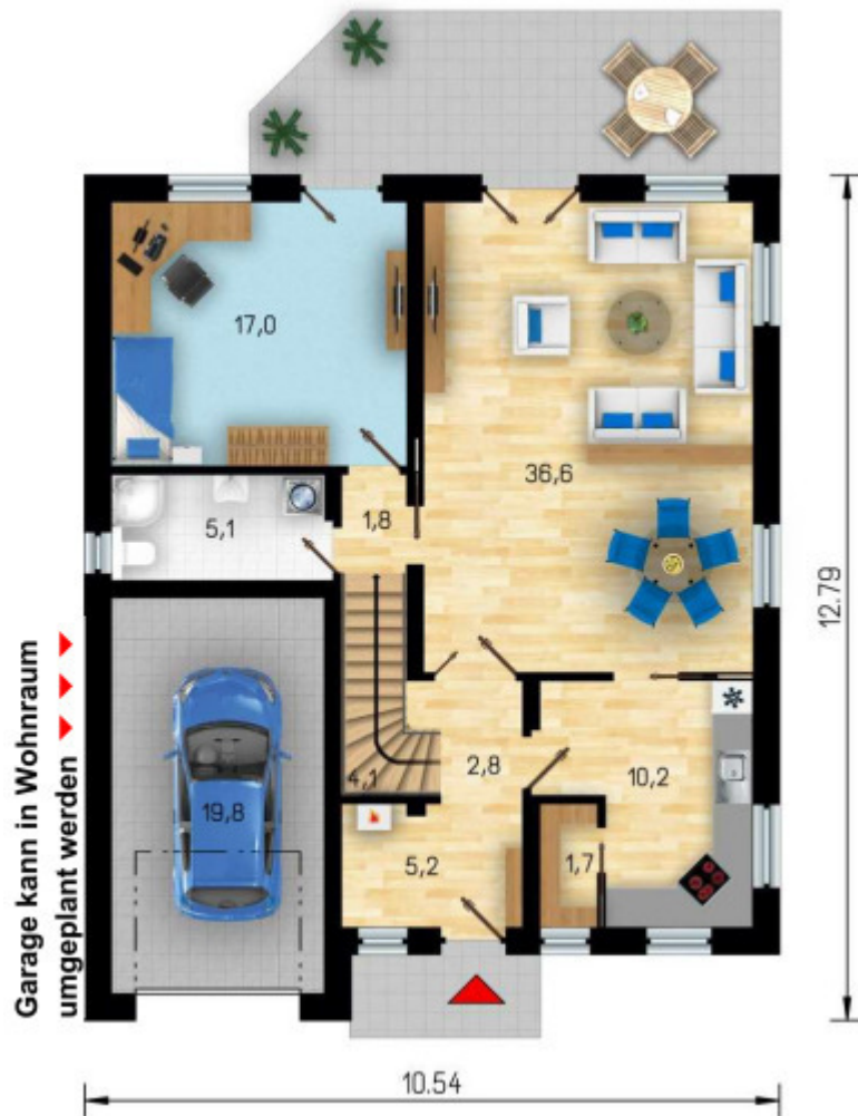
Erdgeschoss mit ca. 104 m 2 Wohn- Nutzfläche