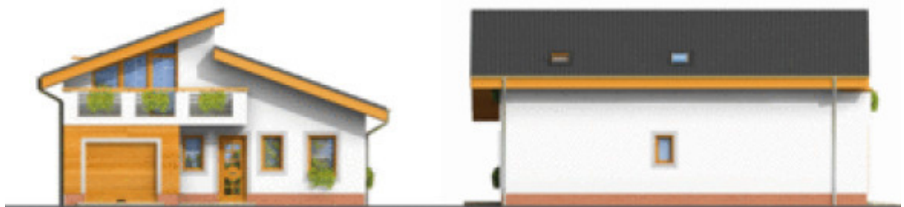
Putzfarbe nach Farbskala