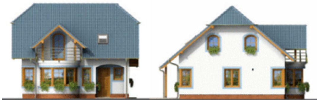
Putzfarbe nach Farbskala