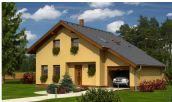
Perspektive mit integrierter Garage Garagenmaß Außen: 3,00 X 8,00 m

— Im Standard einfarbige Putzfassade, Bemusterung nach Farbskala— —Abbildung zeigt Sonderleistungen—