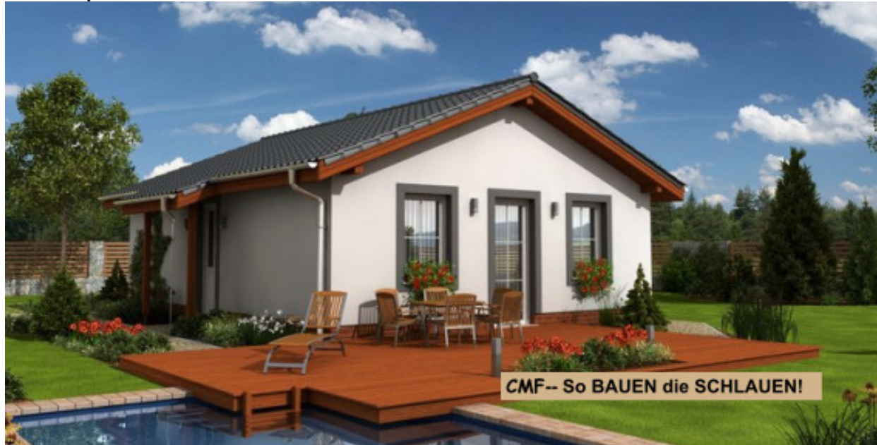
Foto Perspektive 1

— Im Standard einfarbige Putzfassade, Bemusterung nach Farbskala— — Abbildungen zeigen Sonderleistungen—