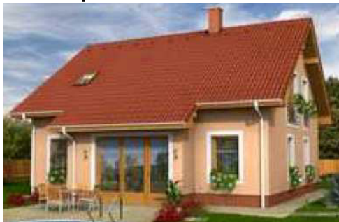
Foto Perspektive 2

— Im Standard einfarbige Putzfassade, Bemusterung nach Farbskala— — Abbildungen zeigen Sonderleistungen —