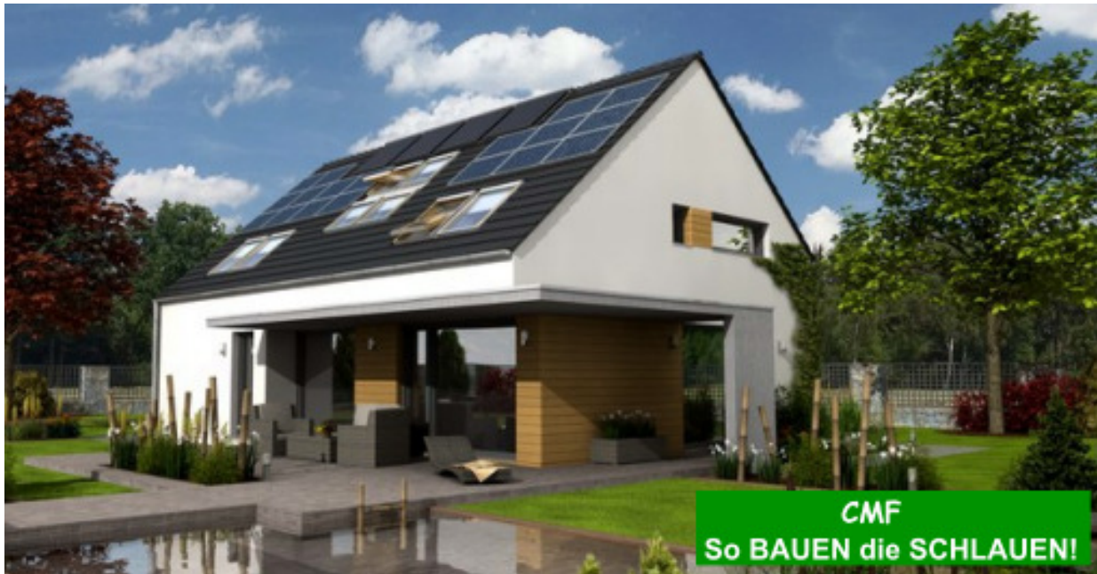
Foto Perspektive 1

— Im Standard einfarbige Putzfassade, Bemusterung nach Farbskala — — Abbildung zeigt Sonderleistungen — Solar ist nicht im Leistungsumfang —