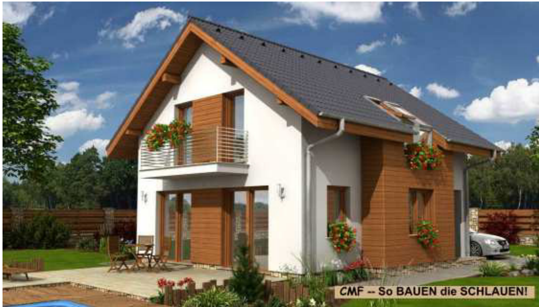
Foto Perspektive 1

Haus des Monats OKTOBER — 2017 auch mit Garage lieferbar!