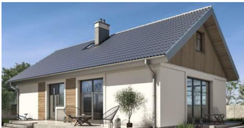
Foto Perspektive 2

— Im Standard einfarbige Putzfassade, Bemusterung nach Farbskala — — Abbildungen zeigen Sonderleistungen —