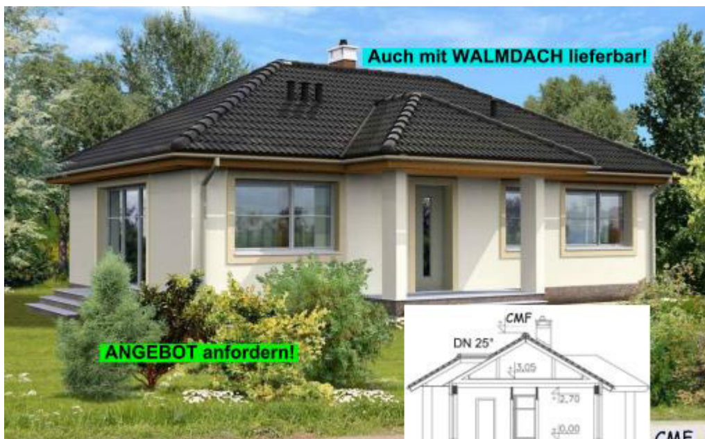
Foto Perspektive 1 mit WALMDACH

Foto Perspektive 1 mit WALMDACH und SCHNITT!