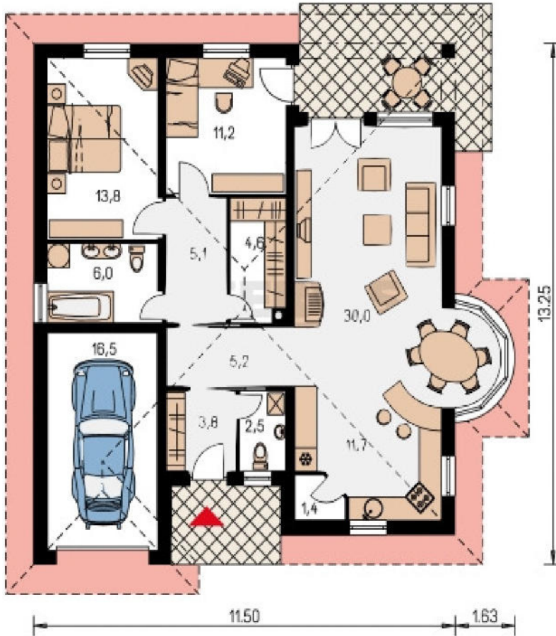
Grundriss – Beispiel – Dachansicht

Grundfläche: 11,50m x 13,25m Umbauter Raum: 730,75m 3 Bebaute Fläche: ca. 150,74m 2