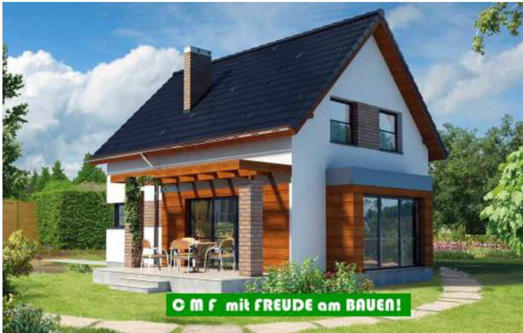
Foto Perspektive 1

— Im Standard einfarbige Putzfassade, Bemusterung nach Farbskala—