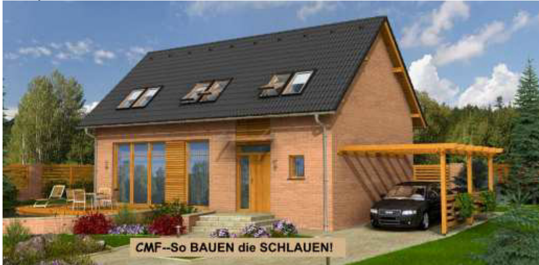
CMF--So BAUEN die SCHLAUEN!

Auch in 2018 noch AKTUELL- CMF = BEZAHLBAR GUT!