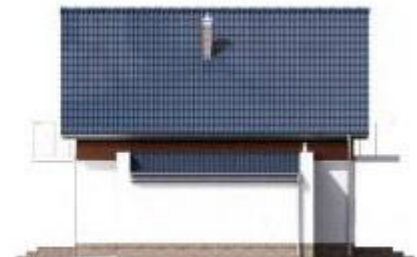
Putzfarbe nach Farbskala