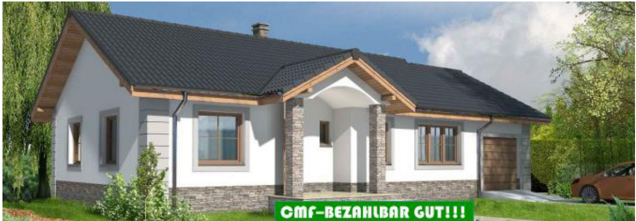
Foto Perspektive 1

— Im Standard einfarbige Putzfassade, Bemusterung nach Farbskala —