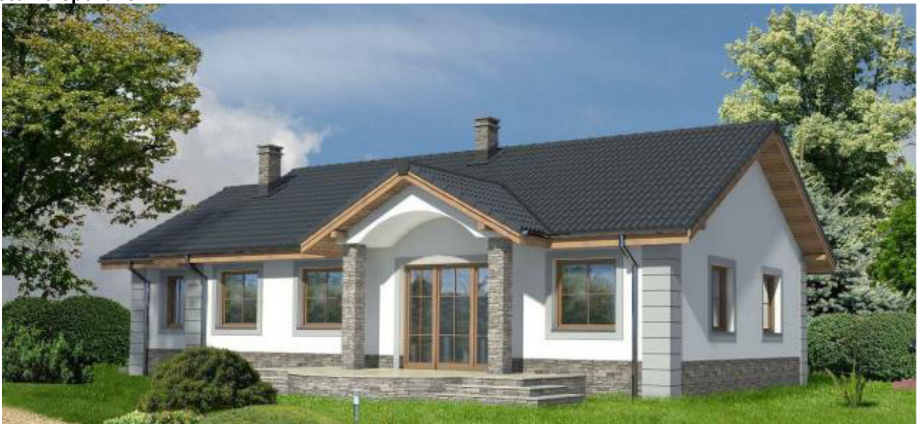
Foto Perspektive 2