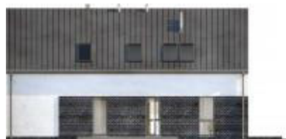
Putzfarbe nach Farbskala