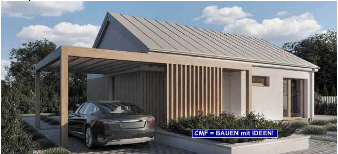
Foto Perspektive 1