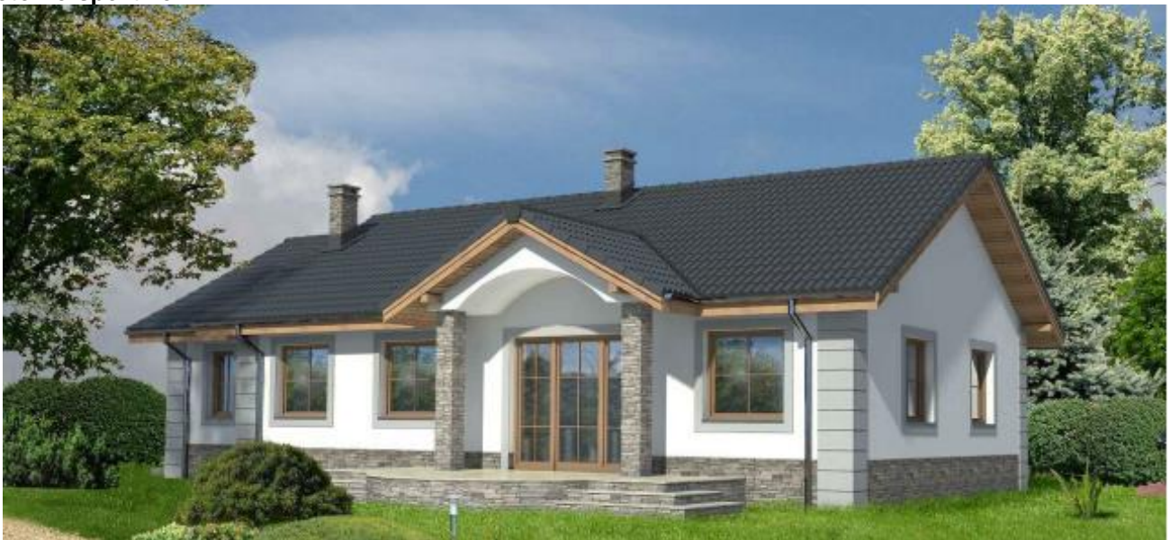
Foto Perspektive 2