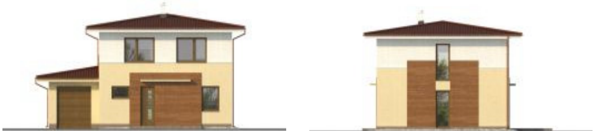
Putzfarbe nach Farbskala