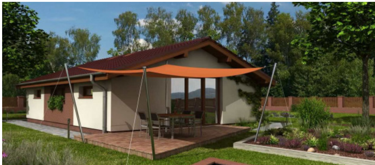
Foto Perspektive 2

Daten Haus BUNGALOW TALON 80 WOHNEN auf einer EBENE